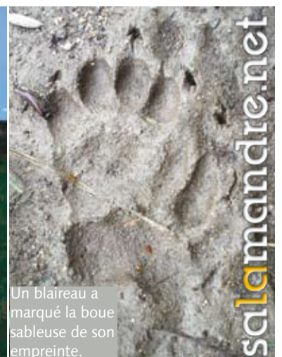
Un blaireau a marqué la boue sableuse de son empreinte.