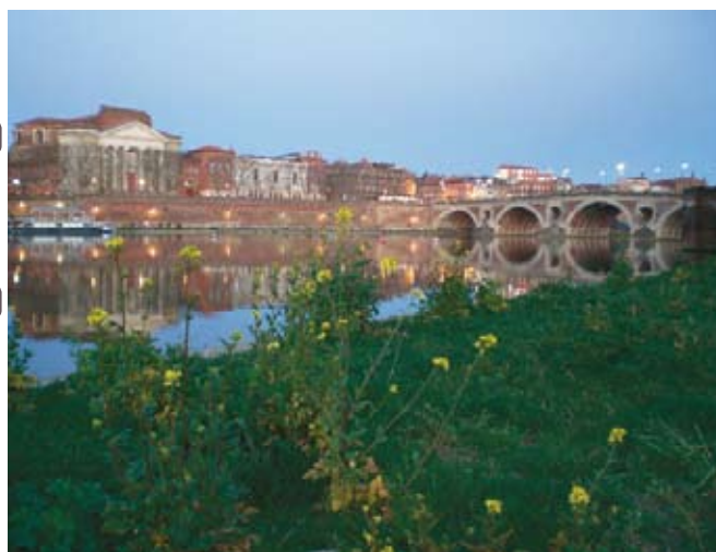
EMMANUEL DI SCALA

1 : 25'000 n°2044 E (Muret - balade 1). n°2143 O (Toulouse - balade 2)